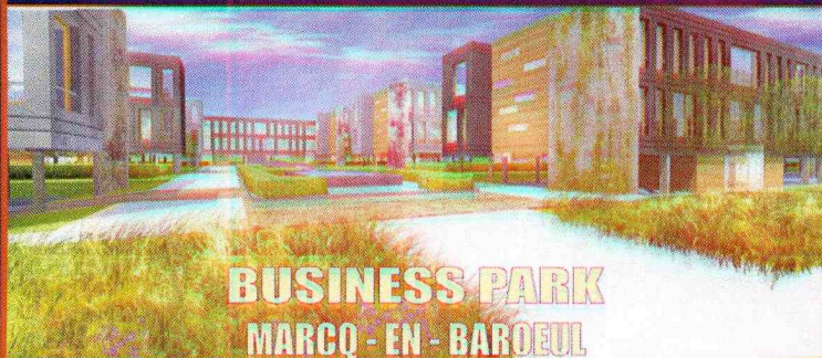
BUSINESS PARK MARCO - EN - BAROEUL

De 400 m 2 à 10.000 m 2 de surfaces de bureaux A LOUER / A VENDRE