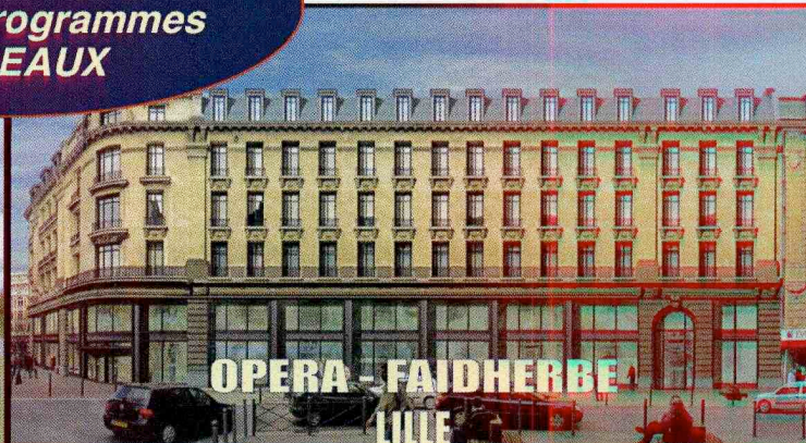
OPERA - FAIDHERBE LILLE

5 immeubles de bureaux divisibles totalisant 15.900 m 2 A LOUER / A VENDRE