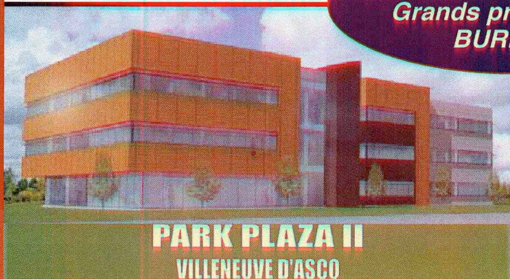
PARK PLAZA II VILLENEUVE D'ASCQ

MÉTROPOLE LILLOISE Grands programmes BUREAUX