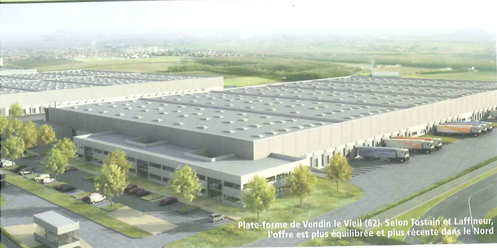
Plate-forme de Vendin le Vieil (62). Selon Tostain et Laffineur, l'offre est plus équilibrée et plus récente dans le Nord