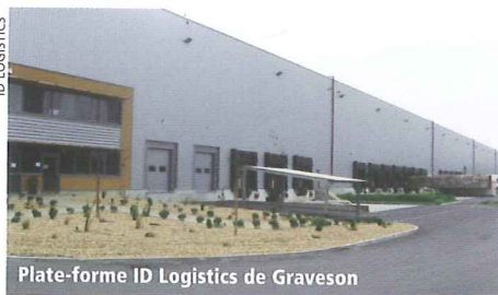
Plate-forme ID Logistics de Graveson

Inaugurée le 30 avril 2010, la plate-forme ID Logistics de Graveson près d'Avignon centralisera sur 36.000 m 2 les activités logistiques de l'enseigne Boulanger (multimédia et électroménager) pour tout le Sud de la France. La plate-forme de Graveson a été développée par l'investisseur Parcolog-Generali et construite par ABCD.