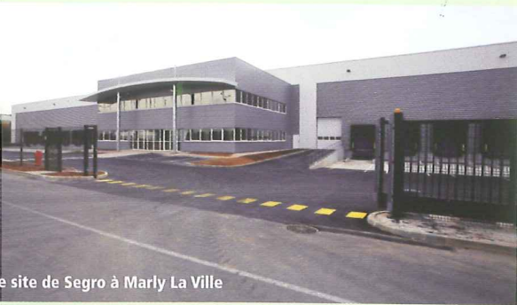
Le site de Segro à Marly La Ville

Ce bâtiment de 20 000 m 2 est déjà entièrement loué à Aurlane, fabricant de meuble qui a pris 11 000 m 2 et Publidispatch, filiale du Groupe Staci, spécialiste de la logistique publi-promotionnelle. ■