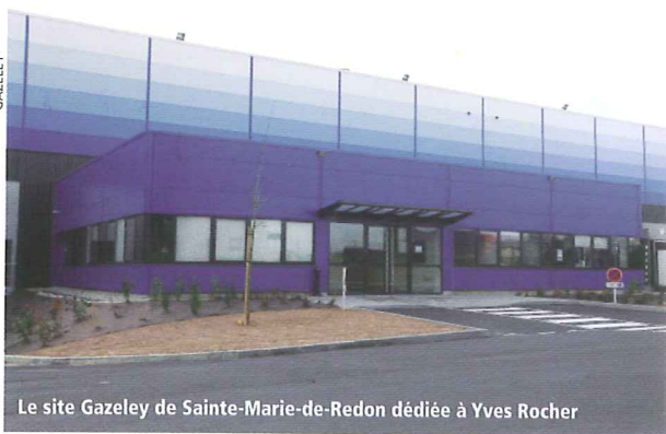
Le site Gazeley de Sainte-Marie-de-Redon dédiée à Yves Rocher

Destinée aux 2 usines du Groupe à Rieux et à